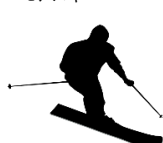
スレッドトゥック (エッジ有り)