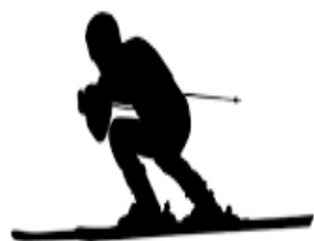
テレマークスキー