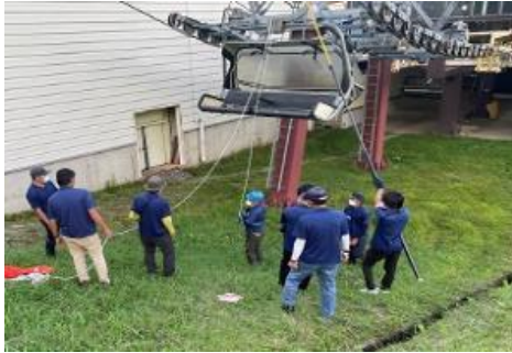
【夏季シーズン前救助訓練】