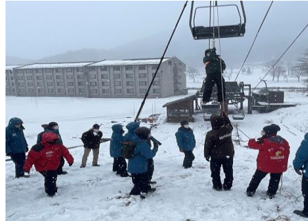
【冬季シーズン前救助訓練】