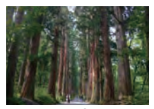
戸隠高原 (ホテルから車で40分)