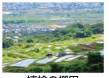
姨捨の棚田 (ホテルから車で90分)