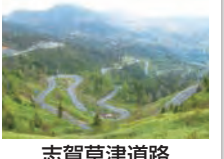
志賀草津道路 (ホテルから車で60分)