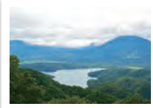
野尻湖 (ホテルから車で15分)