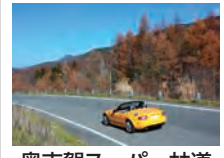
奥志賀スーパー林道 (ホテルから車で60分)