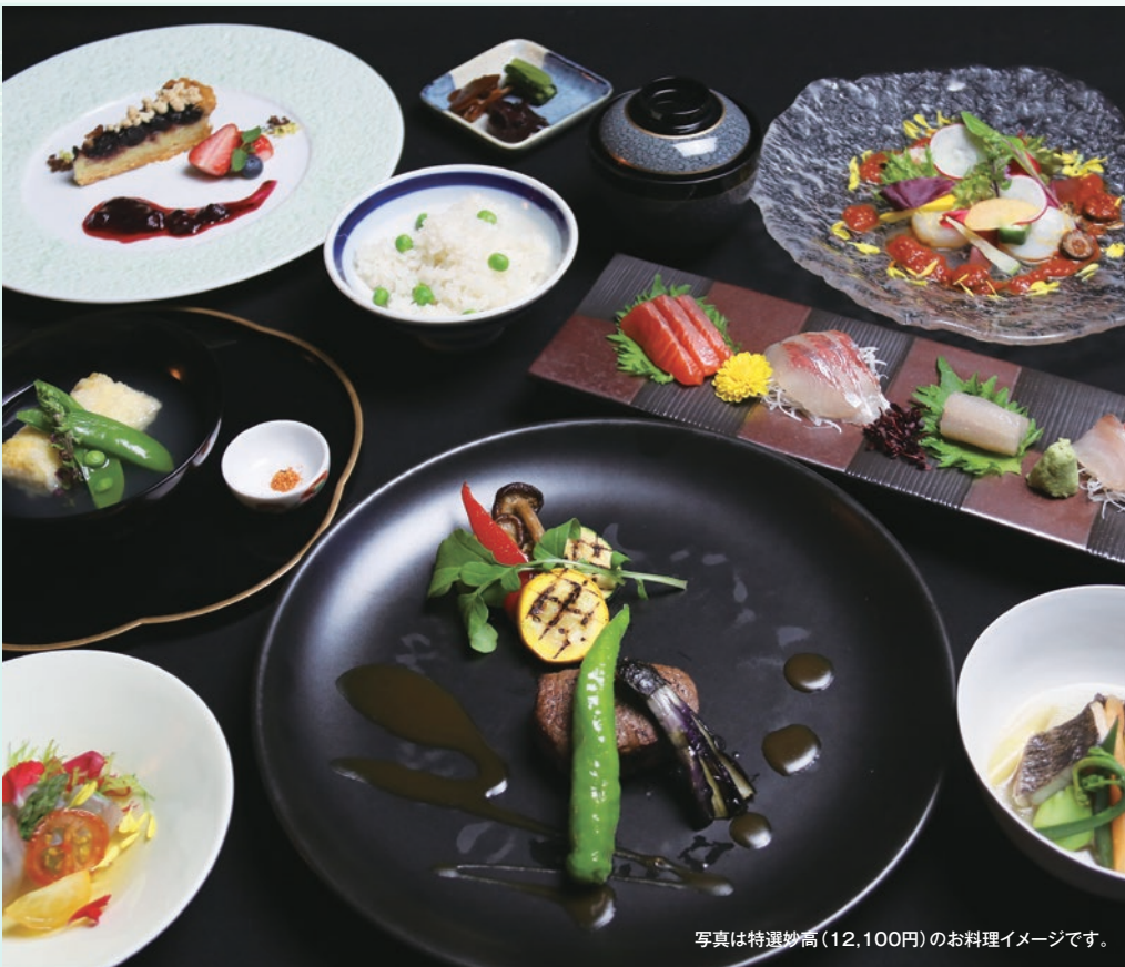
写真は特選妙高(12,100円)のお料理イメージです。

会席料理 お一人様料金 通常妙高 7,920円 (税込) 特選妙高 12,100円 (税込)